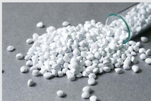
Caco3 Master Batch 碳酸鈣母粒實體照片