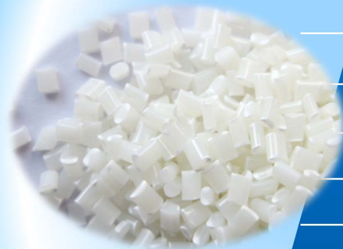
STC5抗靜電劑 Anti-Static MB STC5